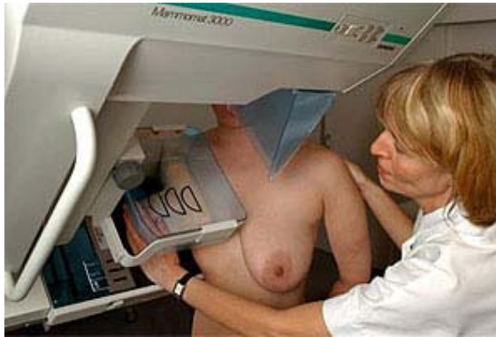
Frauen zwischen 50 und 69 Jahren gehören zur Risikogruppe.

Eine der niedrigsten Mortalitätsraten europaweit.